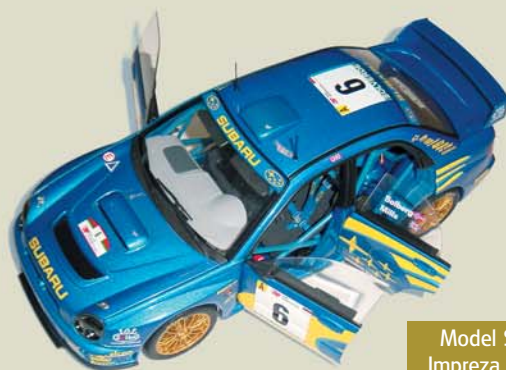
Model Subaru Impreza WRC 01 Cena: 2257 Kč