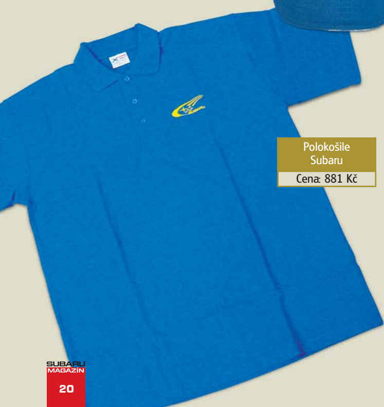
Polokošile Subaru Cena: 881 Kč