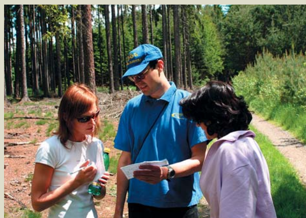
Orientační mikrozávod je fajn relax