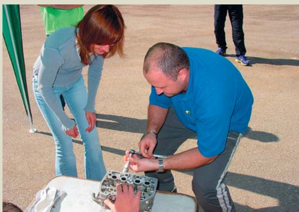
Zručnost subaristům není cizí