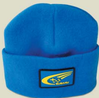
Zimní čepička Cena: 642 Kč