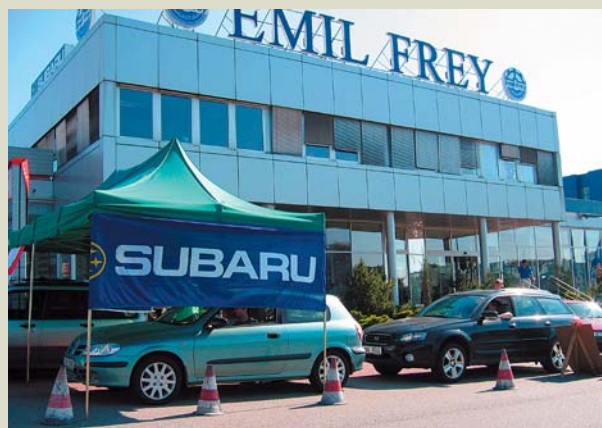
Těšíte se? Příští rok startujeme opět!