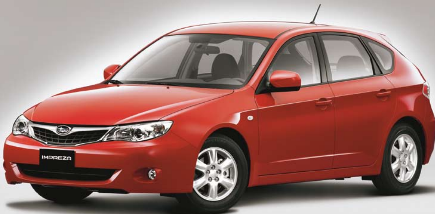
SUBARU Impreza 2,0R Comfort