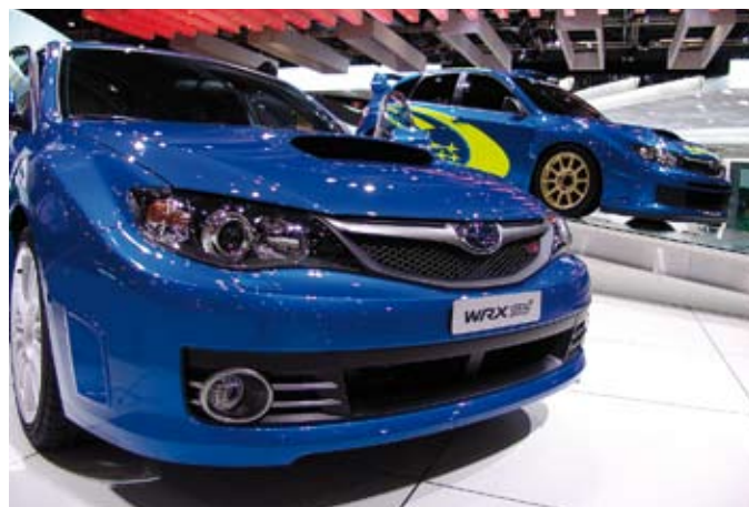
Subaru Impreza WRX STI je nyní ještě nabroušenějším sportovním vozem než tomu bylo v minulosti

Letošní expozice největšího světového výrobce vozů s pohonem všech kol pak ukázala, že o výrobky značky se šesti hvězdami je stále větší zájem u evropských motoristů a příchod dieselových verzí jistě prodeje značky na starém kontinentě ještě zvýší. Značka pak ukázala i trvajícím zájem o motoristický sport a s novým modelem Imprezy WRC pomýšlí na návrat na absolutně nejvyšší příčky ve světovém šampionátu. ✦ Text a foto: VOJTĚCH ŠTAJF