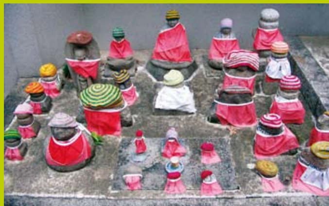
Malí kamenní bůžkové Džizó, patroni dětí, s barevnými slintáčky a čepičkami u chrámu Rokkakudō v Kjótu.

moudrost, dlouhý život a hezké stáří a doprovázejí je další symboly dlouhého život, kterými jsou v Japonsku želva, jeřáb nebo jelen. Tlustý bůžek Hotei s obnaženým břichem a veselým úsměvem na tváři je vyrovnaný, dobrosrdečný a šťastný. Asi takový, jako by měl být každý z nás. Tento bůžek má patrně lidský původ v tlustém čínském mnichovi Pu-tajovi, který putoval původně po čínských vesnicích s velkým vakem, žebral a vykládal budoucnost. Lidé ho začali považovat za převtělení bódhisattvy Maitréji. Jediný bůžek s hrozným výrazem ve tváři je Bišamonten a to proto, že má už jen svým vzezřením chránit před vším zlem. Je sice považován za válečné božstvo, ale drží v ruce malou pagodu, která je plná peněz a lidem přináší štěstí a bohatství. Bente je mezi bůžky jediná žena, bohyně lásky a štěstí v manželství, jezdí na drakovi nebo na mořském hadu a její svatyně bývají často na břehu moře. Nejznámější a nejhojněji navštěvovaná je její svatyně na ostrůvku Enosima u Kamakury, jiná, velmi známá, je přímo v centru Tokia v parku Ueno. Bente je také patronkou hudby, proto mívá často v ruce loutnu.