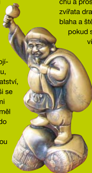
Ztvárnění bůžka Daikoku ve svatyni Džišú v komplexu chrámu Kijomizudera v Kjótu.

S různými symboly se návštěvník Japonska setkává doslova na každém kroku, aniž by to tušil. Červená barva symbolizuje štěstí zejména v kombinaci s bílou, bambus jako základní surovina pro výrobu každodenních potřeb i jako potravina je symbolem úspěchu a prosperity, vážky a netopýři přinášejí štěstí stejně jako bájná zvířata drak a fénix, kapr je symbolem síly a mrštnosti, broskev blaha a štěstí, lotos čistoty a neposkvřenosti. Nejvíce působí, pokud se symboly navzájem sdrúží jako např. tři přátelé: borovice, bambus a slivoň, kterým se říká šóčikubai a společně přinášejí odolnost proti chladu, ohebnost, dlouhověkost a štěstí. I všechna zvířata ve zvěrokruhu jsou nějakým způsobem charakterizována a jedinci narození v určitém znamení jsou nadáni určitými charakterovými vlastnostmi. Např. lidé zrození v roce myši, tedy právě letos, mají čínorodí a úspěšní v praktickém životě. A zrodil-li se někdo v např. ve znamení draka, což je vůbec nejlepší znamení, pak by měl být chráněn dokonale. Určitě ale nezaškodí, když i on občas zajde poprosit o podporu další božstva japonského pantheonu např. Darumu, aby mu za domalované oko splnil přání, Džizóa, aby ochránil děti a pocestné, Dósodžina o ochranu vesnice před zlými silami a nemocemi a bohyni milosrdenství, Kannon, o slitování.