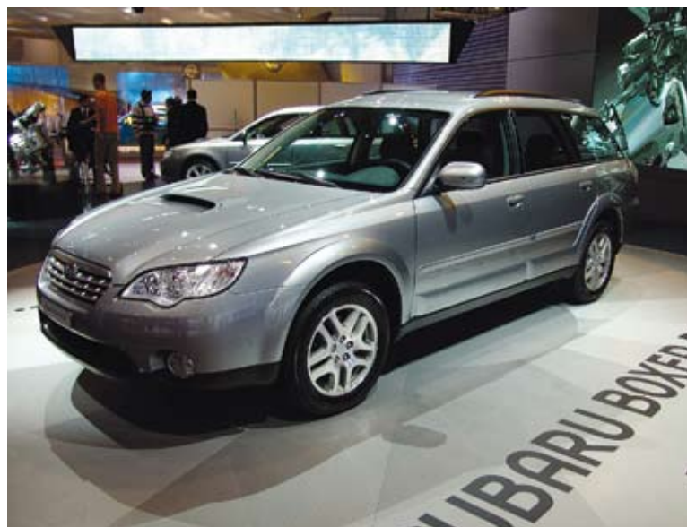
Outback s dieselovým motorem se v Evropě zřejmě stane prodejním hitem

mem nejen pro pohon AWD, ale také pro motory boxer, pojďme vyvinout takový vznětový motor. A jak říká naše reklamní heslo – je tady! („Subaru boxer diesel. It's here“ je mottem chystané reklamní kampaně Subaru v Evropě, pozn. red.) A ohlas, jak sám na našem stánku vidíte, je k mému potěšení veliký.