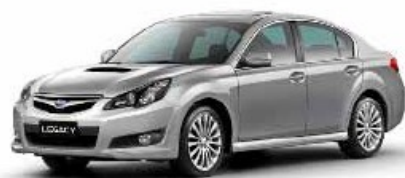
Legacy Sedan 2.0D Sport

Nové modely se začnou v Evropě prodávat s přicházejícím podzimem (v ČR se prodej plánuje od přelomu října a listopadu).