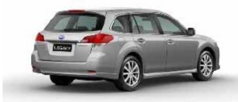
Legacy Station Wagon 2.5i