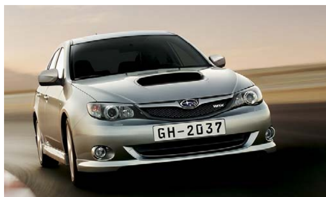
Subaru Impreza 2.5 WRX 265

Praha, 28. dubna 2009: Subaru ČR, importér vozů Subaru do České republiky, uvádí na trh nový modelový rok 2009 Subaru Impreza 2.5 WRX s označením 265, s přitvrzeným podvozkem a výkonnějším motorem (195 kW / 265k) pro ještě adrenalinovější zážitky na hraně a ještě vyšší výkon bravurně přenášený na vozovku. WRX 265 nabízí výkon a jízdní zážitky pro opravdové nadšence. Jako vždy používá stálý pohon všech kol Symmetrical AWD, který je základní technologií značky Subaru, stejně tak jako originální plochý přeplňovaný motor boxer s protiběžnými písty o objemu 2,5l.