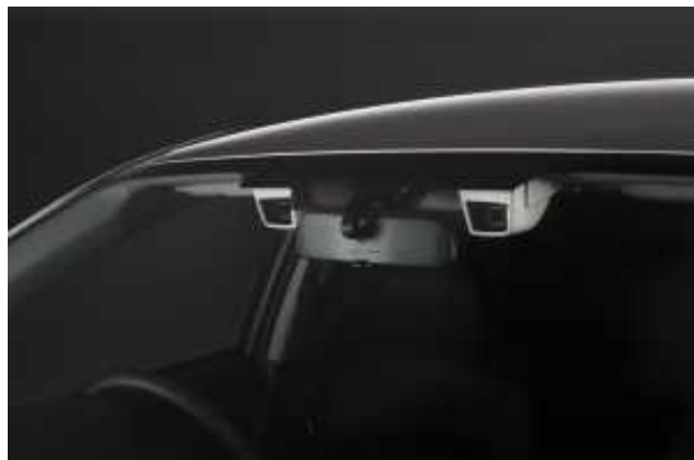
Kamery systému EyeSight

Současný systém EyeSight, který se v Japonsku poprvé objevil v roce 2010, se od prosince 2011 nabízí ve vozech určených pro Austrálii. Jako výbava na přání se od roku 2013 objeví na severoamerickém trhu v modelech Legacy a Outback. Systém zahrnuje „funkci nouzového brzdění před nehodou“, „nouzový brzdový asistent“, „adaptivní tempomat s funkcí sledování v celém rozsahu rychlostí“ a „varování před opuštěním jízdního pruhu“.