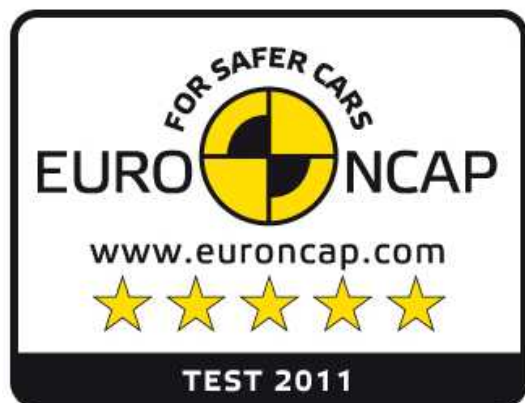
Logo organizace Euro NCAP

Subaru opět zdokonalilo svoji jedinečnou rámovou karoserii s prstencovými výztužemi, kde došlo k optimalizaci přenosu nárazové energie. Nový model XV rovněž využívá ve vyšší míře prvky z vysokopevnostní oceli. Díky provedeným změnám se snížila hmotnost a zároveň zvýšila bezpečnost v případě nárazu ze všech směrů, a tím i zlepšila ochrana cestujících. Ve voze jsou kromě toho zabudovány airbagy v předních sedadlech, u kolene řidiče a po stranách (na ochranu těla i hlavy). Provedená opatření završuje stabilizační systém VDC (zkr. Vehicle Dynamics Control) dodávaný standardně u všech provedení – čímž se z XV stává extrémně bezpečný vůz.