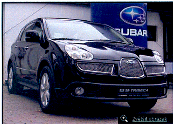
Subaru B9 Tribeca