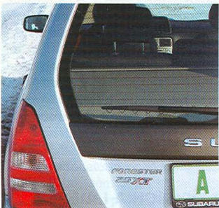
Výkonnějšího turbo-forestera poznáte zvenku pouze podle označení na zadních dveřích

Díky světlé výšce 19,5 cm se forester neztratí ani na cestě pro traktory. Lahůdkou navíc je pak systém „hill-holder“, umožňující rozjetí vozu v kopci bez použití ruční brzdy. Je-li řeč o jízdních vlastnostech, nesmíme zapomenout ani na vynikající brzdy, které se i při velkém zatížení neprojeví slábnoucí účinností, o bezpečnost se pak stará protiblokovací systém ABS. U takto výkonného a objemného motoru je třeba ale počítat s vyšší spotřebou, jež je přímo