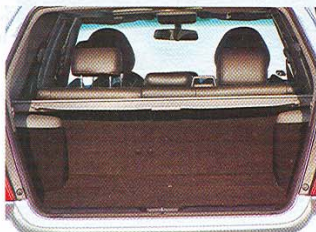
Objem kufru není v základním uspořádání kdovíjak velký, lze ho ale podle potřeby zvětšit sklopením zadních sedadel

Nejvýkonnější Forester 2,5 XT jako vrchol modelové nabídky je k mání pouze v jedné, a to samozřejmě nejluxusněji vybavené verzi. Nechybí tak samočinná klimatizace, výškově stavitelné sedadlo řidiče a sloupek volantu, loketní opěrky předních sedadel v kůži, elektricky ovládaná zrcátka a okna, autorádio s přehrávačem CD či kola z lehkých slitin. Integrovaný navigační systém DVD je super, v Čechách jej řidiči ale ocení, až bude dostupný kompatibilní software. Takto jej lze zatím využívat jen směrem na západ od Rozvadova.