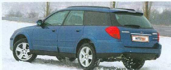
... ZATÍMCO sportovnější náтуры více uspokojí Subaru.