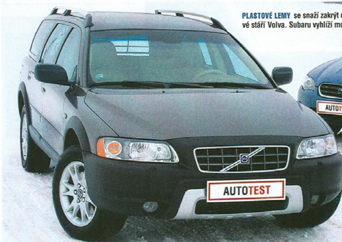
PLASTOVÉ LEMY se snaží zakrýt modelové stáří Volva. Subaru vyhlíží moderněji.

vykoupi zvýšenou spotřebou. Podle firemních údajů sice Outback spolká méně benzínu než Volvo, ale nenechte se mýlit. Tyto hodnoty jsou na hony vzdáleny realitě a docílit jich není v silách sebeúspěšnějšího jedoucího řidiče. Také z toho důvodu si oba allroady odnesly stejné hodnocení za motor, přestože japonský boxer disponuje výrazně vyšším výkonem než švéd. Jenže turbomotor Volva vykazuje větší pružnost a lépe se sbírá z nízkých otáček. Také jeho odhlučnění se nám zdálo o chloupek lepší. Japonsko-švédský du-el skončil nejtěsnějším možným vítězstvím Subaru. Pomohla mu k němu především příznivější cena a jistější jízdní vlastnosti. Volvo přesvědčilo prostomostí a kvalitnějším zpracováním detailů. Na jeho karoserii však už začíná být vidět pokročilejší věk modelu. ■