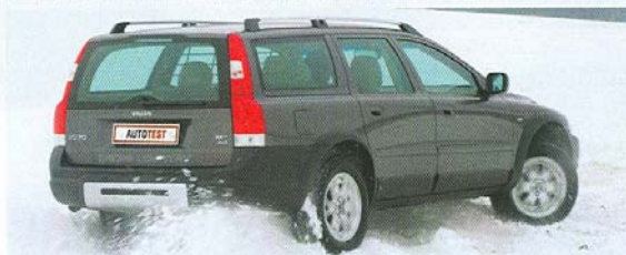
VOLVO preferuje rychlé, ale důstojné cestování...