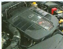
PLOCHÝ šestiválec se chlubí výkonem.