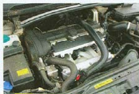
PĚTIVALCOVÝ turbomotor vyniká pružností.