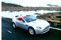
Aston Martin V8 Vantage Roadster