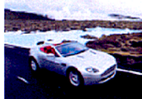
Aston Martin V8 Vantage Roadster