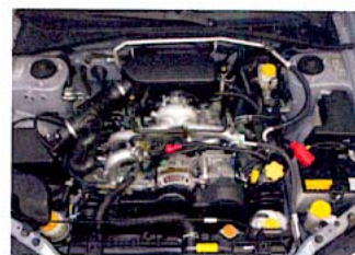
Boxer dodává výkon 105 koní.