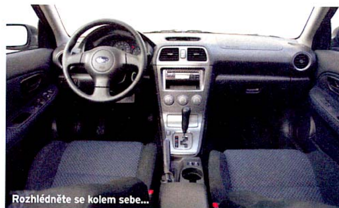
Rozhlédněte se kolem sebe...

všech kol se postarají o zbytek. Vychvalování musí mít nějaký háček, říkáte si nejspíš. Nejde ani tak o usedlý design oživený přední maskou. Jenže otevřete líbivé bezrámové dveře, uveleďte se ve výborně tvarovaných sedáčkách a rozhlédněte se kolem sebe. Konstrukteři v Subaru se bohužel natolik zahleděli do techniky, že zapomínají na estetické citění. Nuzné plasty, nudný vzhled, průměrné rádio a legračně tenká řadič páka s hlavíčkou, která se ne zrovna příjemně drží. To není dobrá vizitka, i když zpracování se nedá téměř nic vytknout. Pokud nemáte souhvězdími potetované celé tělo, auto za půl milionu si uvnitř představujete asi jinak. Jestliže