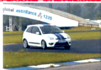
5. místo: Ford Fiesta ST