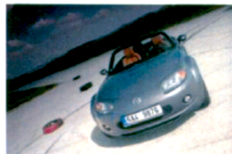
2. místo: Mazda MX-5