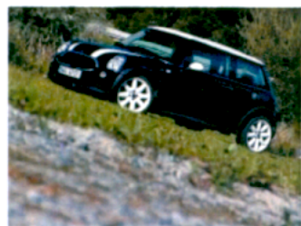
3. místo: Mini Cooper S