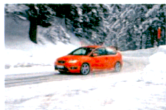
1. místo: Ford Focus ST