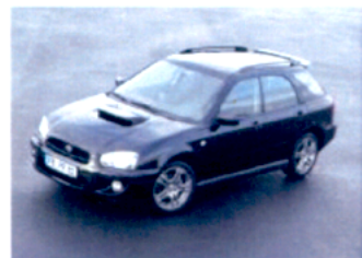
4. místo: Subaru Impreza WRX