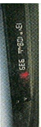
mí počítat ukazuje jen průměrnou obou, větší teplotu a čas

Obházený boxer je pastvou pro oči technika. I přes absenci krytí se jeho ojev drží v nižších otáčkách při zemi.