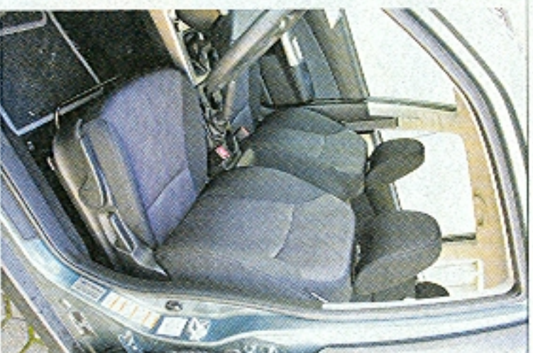
V pohodlných sedadlech najde skvělou polohu každý. Boční vedení by chtělo zlepšit.

Hurá do terénu! Poháčku přeletí Forester bez mrknutí oka, pole mu už dá trochu zahrát a většímu off-roadu se bude lepší vyhnout. Každopádně toho svede víc než minulý Forester hlavně díky silně světlosti 215 mm. Nejen v terénu pak pomůže standardní asistent rozjezdu do kopce.