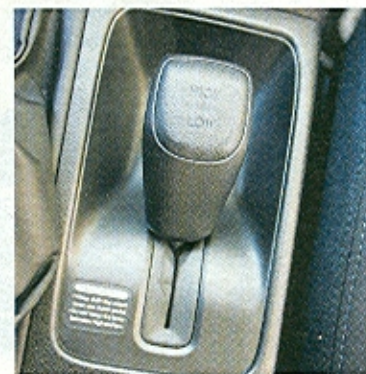
Díky standardní redukci v poměru 1,45:1 máte z pěti převodů hned dvojnásobek