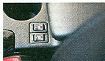
Kromě základní verze disponují dvou- a třístupňovým vyhříváním všechny forestery