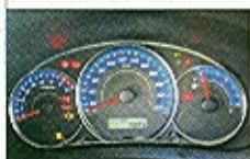
Přístroje vypadají efektně, ale taky trochu poutově

Prakticky každé subaru je zrozeno pro jízdu. Plusové body sbírá i nový Forester – precizní komunikativní řízení (s neskutečně malým poloměrem otáčení 5,3 m!), odolné brzdy s přirozeným náběhem účinku nebo přesné řízení