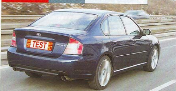
Dvě koncovky výfuku a speciální litá kola prozrazují, že vám dává vale nejrychlejší sériové Subaru Legacy 3.0R spec. B. Složitý název, dobrý výsledek.

Š těstí je prý třeba popostrčit. V případě Subaru to znamenalo „postrčit“ úroveň designu a kvality zpracování. Protože technika trvalého pohonu všech kol je natolik vybroušená, že udělala právě z těchto automobilů nejprodávanější osobní vozy s pohonem všech kol na světě.