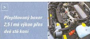
Přeplňovaný boxer 2,5 l má výkon přes dvě stě koní

Už hlavička tohoto článku naznačila, že jsme se v případě jízdy s novou špičkovou verzí foresteru rozhodně nenudili. Novinka v nabídce japonské značky je totiž nenápadným dravcem a svými trakčními schopnostmi dovede i v zimních měsících nadělit řidiči nezapomenutelné zážitky za volantem.