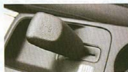
Výjimečný, ale pro mnohé důležitý prvek: redukční převodovka.