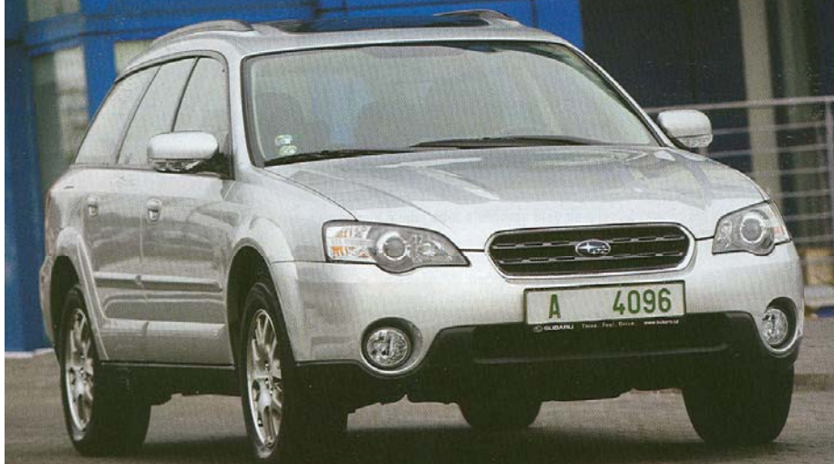
Legacy Outback vypadá sportovně a zdání rozhodně nezklame: na silnici si s „běžnými“ kombi nezadá, poradí si ovšem i s lehkým terénem.