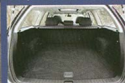
Zavazadlový prostor o objemu 0,459 m 3 lze výborně využít.