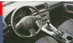
Interiér je jednoduchý, ale plně funkční a kvalitně zpracovaný.