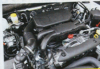
Dvouapůllitru nechybí hladkost.

nebudete na jízdní vlastnosti více stěžovat. Řízení, ač akurátní, prostrádá ostrost okolo středu, ale vůz perfektně zpomaluje. Navíc brzdný účinek se dá snadno dávkovat. Tato motorizace bude v Japonsku prodávána s osmnáctipalcovými koly, ale jízda na čemkoli jiném než na kvalitním povrchu by představovala nedůstojný kompromis, takže doporučujeme sedmnáctky anebo šestnáctipalcová kola. Na vrcholu nabídky stojí 3.6R. Jde o šestiválec s výkonem 256 koní v kombinaci s pětistupňovým automatem. Nechybí mu zátaž, vyváženost a perfektní podvozek. Všechny ovladače kladou ten správný odpor, pružiny i tlumiče fungují na výbornou. Samotná motorová jednotka také umí vykouzlit nenucené vý-