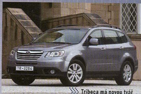
Tribeca má novou tvář

šího modelu, vyzkoušený dvoulitrový boxer pracuje stále skvěle a brzdy jsou ještě o něco ostřejší. Shrnuto a podtrženo, nová Impreza i když vypadá úplně jinak, nabízí to, co od ní zákazník očekává – výborné jízdní vlastnosti a ještě něco navíc – design, který by měl, jak Subaru doufá, přitáhnout masy.