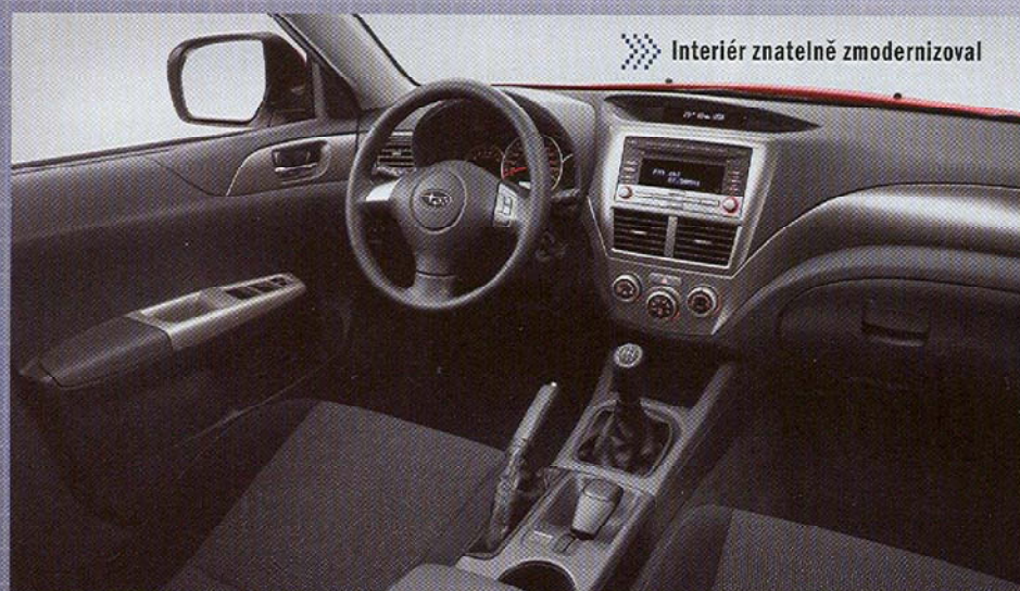
Interiér ztelně zmodernizoval

M inulá Impreza se mi líbila, před faceliftem se mi dokonce líbila ještě víc. Tribeca byla v segmentu SUV nositelkou neotřelých tvarů, které už jaksí samy o sobě říkaly, že tohle není žádná tutovka. Modelový rok 2008 však bude znamenat zemětřesení. Nejen, že přichází naprosto nový Subaru Justy bez pohonu všech kol, ale i zcela nová Impreza a výrazně faceliftovaná Tribeca. Když to vezmeme popořadě od nejmenšího a začneme u Justy, jde vlastně take o jakousi maiou