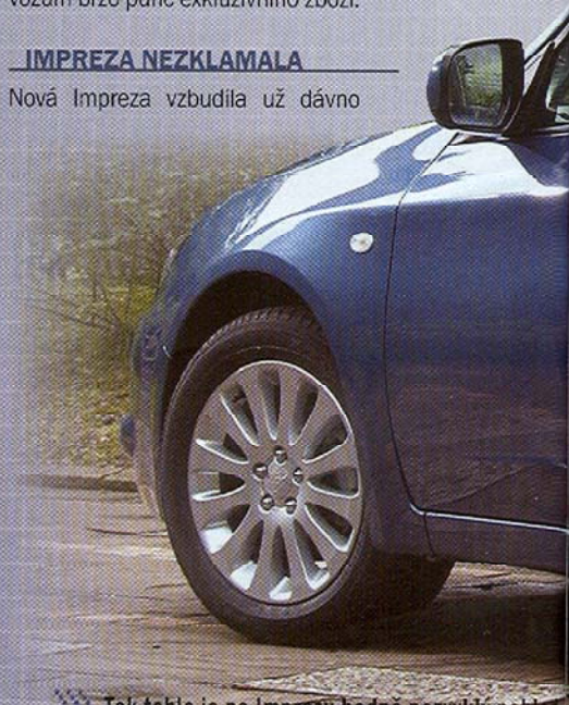
Tak tohle je na Imprezu hodně nezvyklý pohled