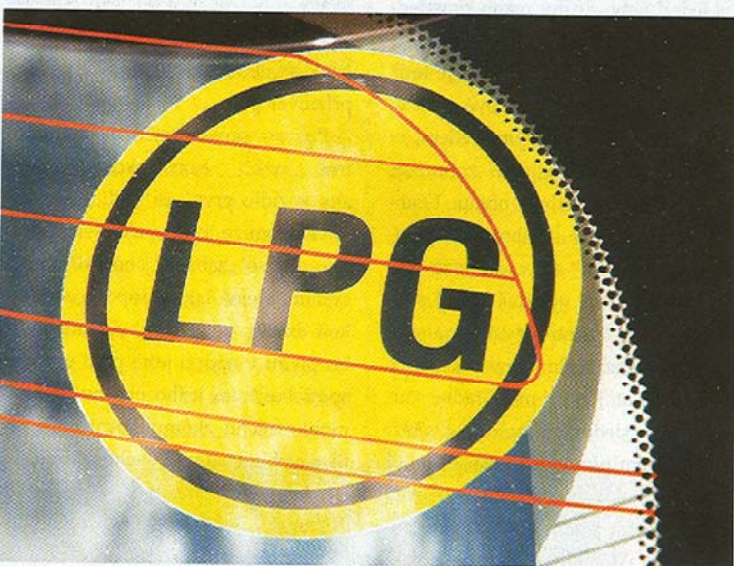
Povinná nálepka na zadním skle informuje okolí o tom, že toto vozidlo je vybaveno soustavou pro spalování LPG a nesmí tedy například do podzemních garáží (některých!)

pákou z místa řidiče. Její aktivace činí z foresteru vyslovené terénní vozidlo. Ozdobou celku je symetrický systém stálého pohonu všech kol s třemi diferenciály a zadním s viskózní „měkkou“ spojkou podstatně zvětšující průchodnost terénem, ale i stabilitu vozidla ve velkých rychlostech. Jediným limitem jeho možností mimo zpevněné komunikace je schopnost pneumatik přenést točivý moment hnacího ústrojí na podklad, částečně i světla výška činicí velmi solidních 209 mm, nebo nájezdové úhly, které v obou směrech činí 22° a přechodový úhel 20°. To jsou u vozidel kategorie SUV či crossover výjimečné parametry. Ostatně na terénních kvalitách foresteru si výrobce právem zakládá.