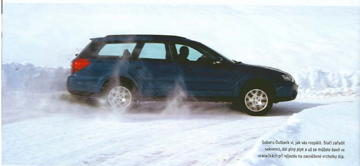
Subaru Outback ví, jak vás rozpálit. Stačí zařadit sekvenční, dát plyn a už se můžete bavit ve vracečkách při výjezdu na zasněžené vrcholky Alp.

P o přečtení úvodních vět u vás jistě vyvstane otázka, proč jsme zvolili právě spojením Subaru a rakouských Alp. Odpověď je naprosto jednoduchá a stručná, i když v sobě skrývá hned několik důvodů. Subaru bylo jednou z prvních značek, které před necelými deseti lety vystoupilo z řady a světu představilo víceúčelový vůz, kombinující schopnosti rodinných aut a lehkých off-roadů. Neméně zajímavou výzvou bylo pro nás prověření nové generace Subaru Outback s 2,5litrovým plochým čtyřválcem, čtyřstupňovou automatickou převodovkou a stálým pohonem čtyř kol. Třetím faktorem bylo vytvoření náročné trasy pro nestandardní test, což cesta Praha-Sankt Johann-Praha splňovala do puntíku. 900 km nabídlo dlouhé kilometry dálnice, několik klikatých okresních silnic u nás i v Rakousku a nakonec i velké množ-