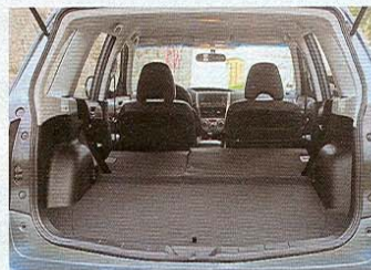
Ve dvou odvezete až 1660 l zavazadel