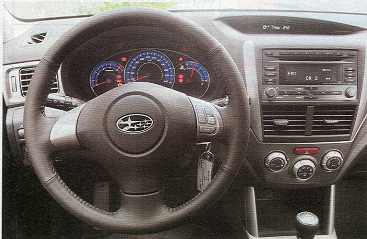
V přehledném interiéru ruší jenom grafika přístrojů a ovládání autorádia