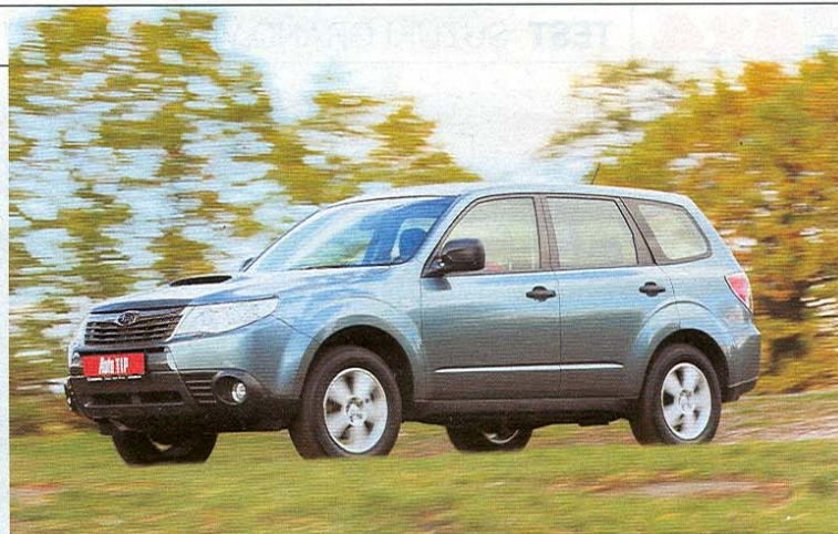
I bez redukce se s foresterem můžete směle vydat mimo zpevněné komunikace

Subaru si dlouhá léta drželo výlučnost ve výrobě automobilů výhradně s pohonem 4x4 a poháněných zážehovým motorem. První zásada padla s nástupem aktuálního justy, které pořídíte i ve verzi s pohonem pouze předních kol, ta druhá pak s představením turbodieselu vlastního vývoje. Důležité je, že v obou případech si značka dokázala zachovat tradiční přednosti a nevydala se na cestu unifikace a bezhlavé globalizace.