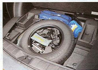
V terénu oceníte plnohodnotné kolo