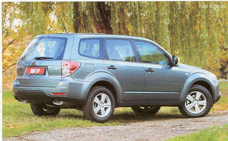
Forester je praktičností a skromností lesník, výkony sportovec a pohodlím hoteliér