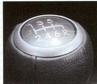
Šestka snižuje hlučnost a spotřebu