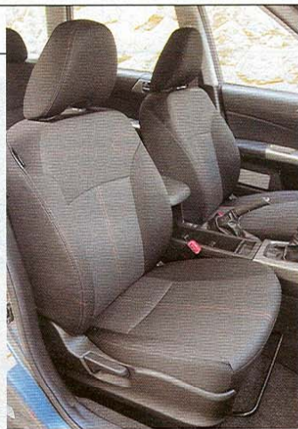
Sedadla vyhoví i na delších cestách