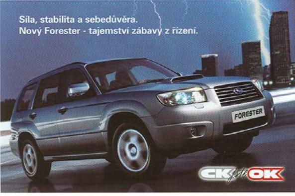
18 4X4 AUTOMAGAZÍN [LÍPEN 2005]

subaru výkon motoru dobře koresponduje s perfektně odladěným podvozkem a na vyšší SUV dosti nízko položeným těžištěm, což umožňuje využít beze zbytku potenciál motoru. V době pěti-, šesti-, a dokonce sedmistupňových převodovek se zdá být čtyřstupňový „automat“ Foresteru anachronismem, nicméně technici Subaru zřejmě vědí, co dělají, protože řazení této převodovky je velmi komfortní a dobře odpovídá na požadavky řidiče. Částečně je navíc možné ovládat převodovku prostřednictvím pseudomanuálního režimu. Nový Forester je opět v plné kondici a je připraven nabídnout své služby i v provedení N1, připravuje se také varianta na plyn, která se úspěšně prodávala na jaře a která je v dnešní ropné krizi aktuální více než kdykoliv předtím. ■ Text: Jiří Kaloč