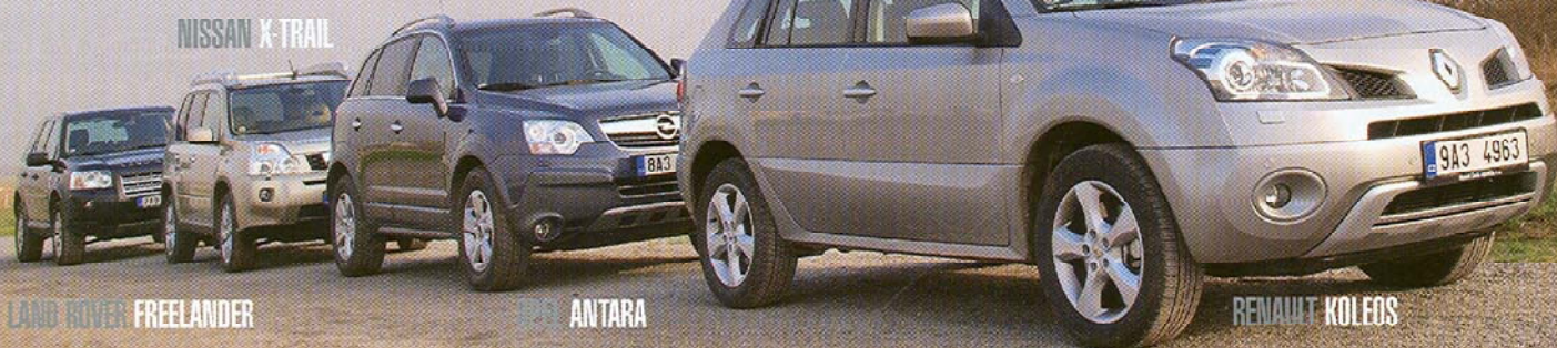
LAND ROVER FREELANDER