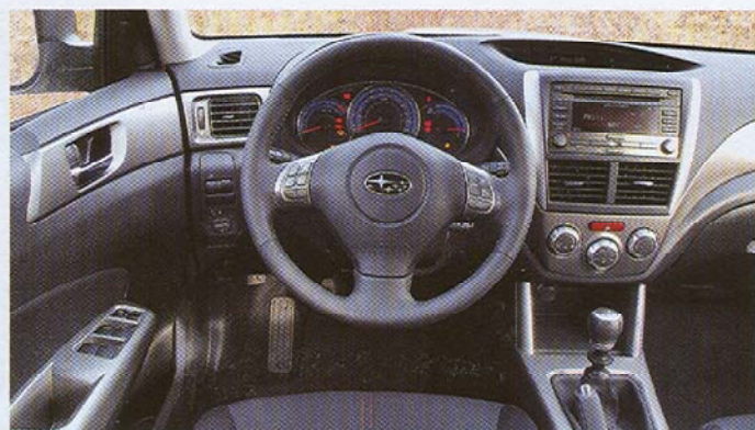
▲ Interiér Foresteru má mnoho společných znaků s Imprezou a vyniká kvalitním zpracováním a perfektní ergonomií ovládacích prvků

pod přední kapotou. Pětice cestujících může očekávat dostatek místa ve všech směrech a také dostatek odkládacích prostor. Obdobné je to s místem na hlavu. Zavazadlový prostor má průměrný základní objem 450 l, který lze jednoduchým sklopením zadních sedadel, dělených v poměru 60/40, zvětšit až na 1660 l. Nechybí ani čtveřice háčků na tašky a úchytná oka. Nákladová hrana je trochu vyšší, což je daň za koncepci pohonu a určení vozu, který si poradí také s lehčím terénem. Zde ctí Forester tradice svých předchůdců, k čemuž mu pomáhají solidní nájezdové úhly a ochrana spodku vozidla. Zajímavá je i možnost tažení až dvoutunového brzděného přívěsu.