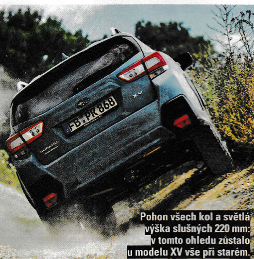
Pohon všech kol a světlá výška slušných 220 mm: v tomto ohledu zůstalo u modelu XV vše při starém.