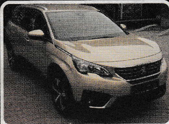
Peugeot 5008 Active 1.6 BlueHDi 120k

LB Automobile - Autocentrum Praha 241 711 643 | www.lbautomobile.cz