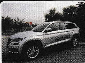
Škoda Kodiaq 2.0TDI / 140kW 4x4 DSG...

Vyrobena 2016 Tachometr 271 km Palivo diesel Cena 1 035 000 Kč