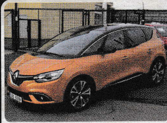
Renault Scénic 1.5dCi PREMIERE EDITION ČR

MK CARS s.r.o. +420 483 305 862 www.mkcars.cz