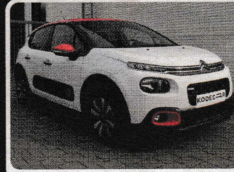
Citroën C3 1,2 PureTech 82k SHINE

AUTO KOUT CENTRUM, spol. s r.o. 326 905 041 | www.autokout.cz