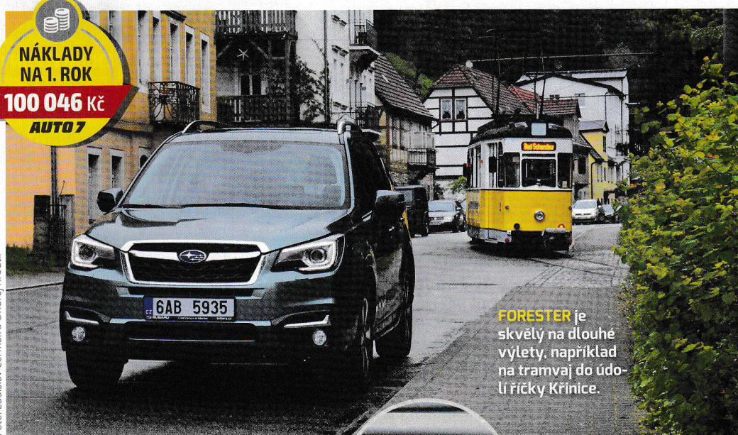
FORESTER je skvělý na dlouhé výlety, například na tramvaj do údolí říčky Králičky.

ÚTULNÉ A HODNOTNÉ interiéry jsou příjemnou novinkou Subaru posledních let.