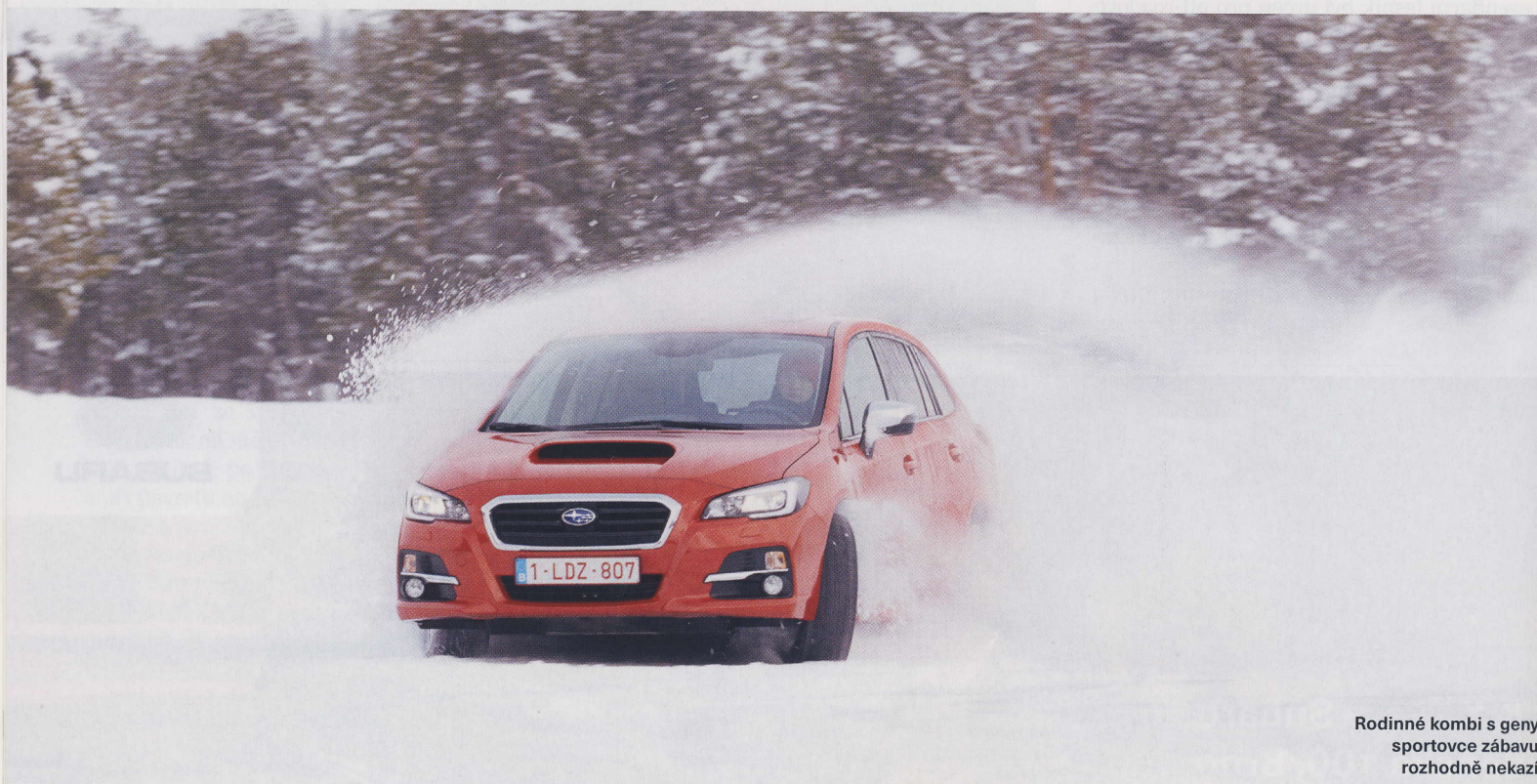
Rodinné kombi s geny sportovce zábavu rozhodně nekazí