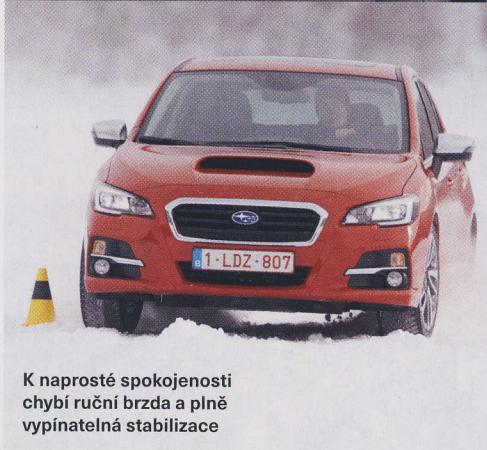
K naprosté spokojenosti chybí ruční brzda a plně vypínatelná stabilizace