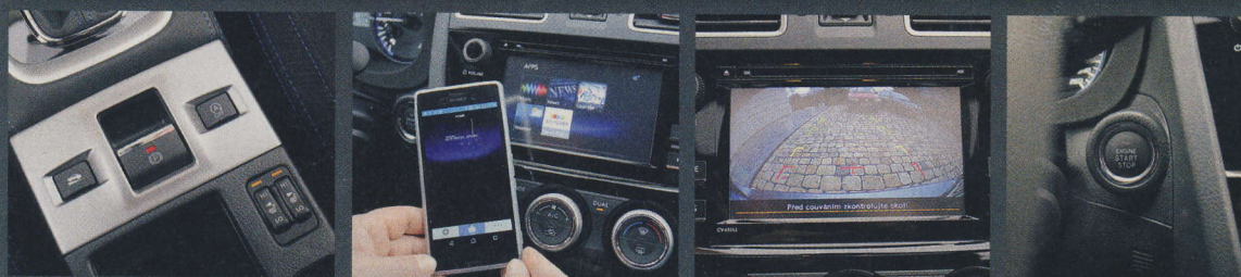
Už ve standardní výbavě Subaru Levorg naleznete elektronickou parkovací brzdou, vyhřívání předních sedadel, připojení chytrých telefonů, parkovací kameru nebo startování tlačítkem

Dostává tedy jedničku, stejně jako auta s cenou do 697 095 Kč. Za cenu od 697 096 Kč do 730 290 Kč udělíme známku 1,25 a tak dále. Podobně postupujeme i při subjektivním hodnocení (vzhled, zpracování), vždy vyčísľujeme odstup od nejlepšího. Známkou můžeme dále upravit, pokud chceme zohlednit například extrémně bohatou výbavu, nadstandardní záruku a podobně. Známkou za oddíl Cena a výbava není součástí celkového hodnocení! Jedná se o samostatnou disciplínu.