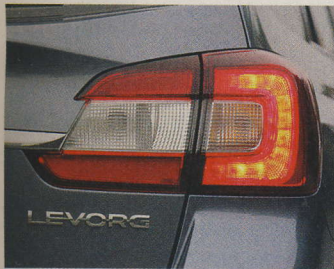
Novinka Subaru je vybavena předními světlomety LED, a tak ani nepřekvapí, že diody najdeme i u zadních světel