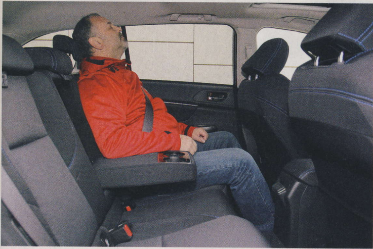
Na zadních sedadlech jsme se cítili dobře. Zejméne v podélném směru jsme zde našli dostatek místa. Na šířku už japonské kombi na konkurenci lehce ztrácí.