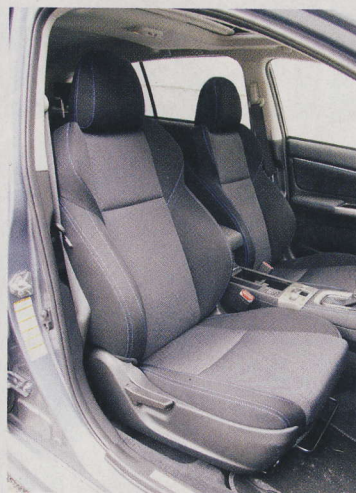
Provedení Comfort nabízí pohodlná sportovně stržená přední sedadla