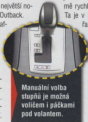
Manuální volba stupňů je možná voličem i páčkami pod volantem.