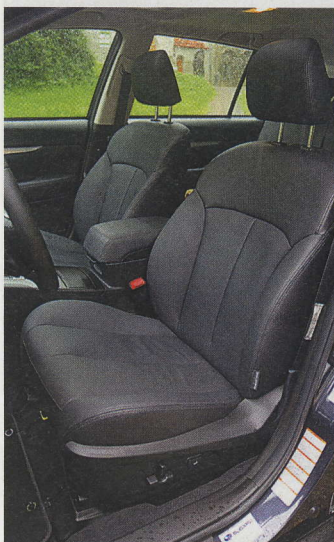
VYSOKÁ ÚROVEŇ komfortu a dostatek prostoru je v outbacku nejen na předních místech.