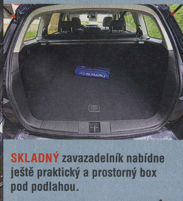
SKLADNÝ zavazadelník nabídne ještě praktický a prostorný box pod podlahou.