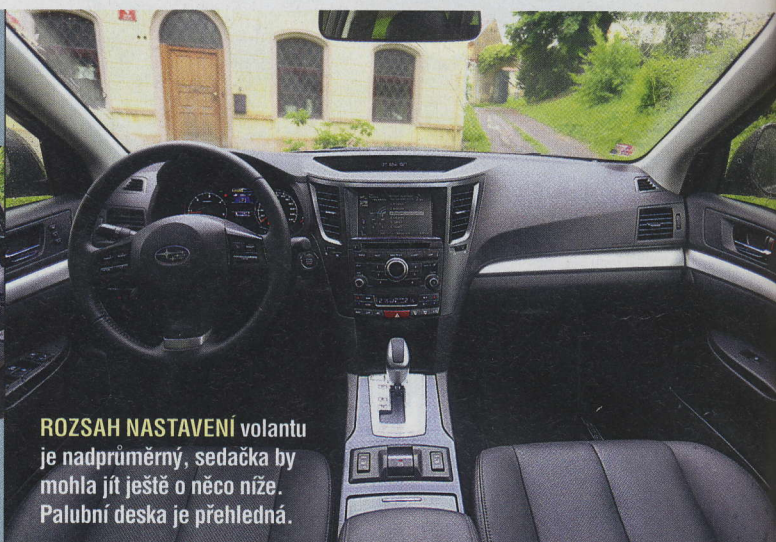
ROZSAH NASTAVENÍ volantu je nadprůměrný, sedačka by mohla jít ještě o něco níže. Palubní deska je přehledná.