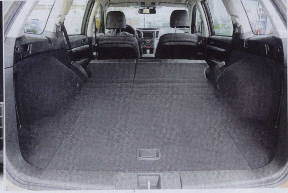
Po sklopení sedadel pomocí páčky se podlaha sklopí do roviny, lze naložit až 1726 litrů