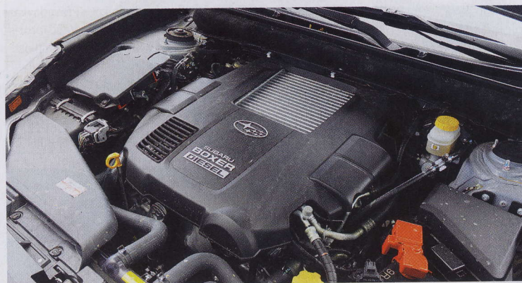
Plochý vznětový čtyřválec si s převodovkou CVT dobře rozumí, protože výkon 110 kW a točivý moment 350 N.m odevzdává v nízkých otáčkách

Kombinace funguje na výbornou. Převodovka totiž využívá sedm virtuálních rychlostních stupňů, a když akcelerační pedál sešlápnete z 60 procent a víc, jako by odřazuje, takže vymizela dřívější největší slabina převodovek CVT, kde při akceleraci motor ve vysokých otáčkách zoufale kvlel. Nyní se systém chováním blíží spíše ke klasickému automatu.