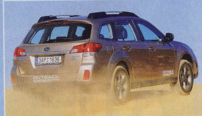
Outback skvěle jezdí, ať už na silnici nebo v lehčím terénu.

Letos však došlo k ještě zásadnější inovaci. Automobilka se rozhodla uspokojit zákazníky, kteří chtějí diesel a sofistikovaný automat – doposud byly ploché turbodiesely spárovány s pětistupňovou samočinnou převodovkou, nyní má Subaru jako jediná značka naftový boxer spojený s variátorovou převodovkou Lineartronic.