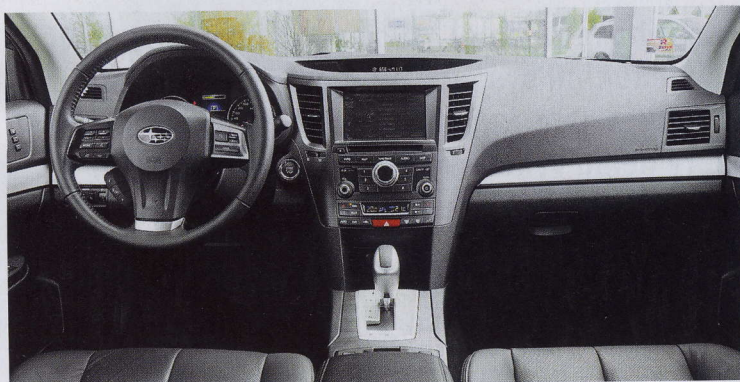
Ve verzi Executive už nelze za nic připlácet. Navigace by ale mohla mít intuitivnější ovládání.

Snad žádná jiná automobilka na trhu není tak „nestandardní“ jako Subaru. Japonská značka se pořád drží dvou zásadních průkopnických řešení – plochých motorů a symetrického pohonu všech kol.