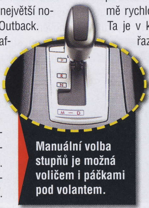
Manuální volba stupňů je možná voličem i páčkami pod volantem.