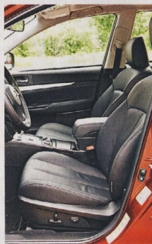
▲ Vyhřívání předních sedadel je dvoustupňové.

✚ jízdní vlast., technika, řízení, prostornost, ovladatelnost, motor, průchodnost terénem ✖ někomu nemusí sednout převodovka, vyšší cena, navigace (displej)