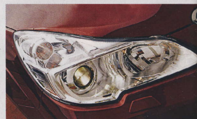
▲ Součástí výbavy jsou i výkonné xenony, Svítí parádně.

✚ jízdní vlast., technika, řízení, prostornost, ovladatelnost, motor, průchodnost terénem ✖ někomu nemusí sednout převodovka, vyšší cena, navigace (displej)