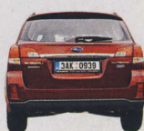
Rozchod vzadu 1540 mm