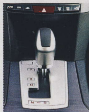
▲ CVT je pro někoho problém. My však říkáme, že si rychle zvyknete. Není tak špatná.

Kabina vozu je velmi prostorná, neregistrovali jsme žádný problém ani při plném obsazení pěti pasažéry. Komfort sedadel je také zcela v pořádku. Co se prostoru pro zavazadla týká, pro něj je připraveno slušných 526 litrů. Po sklopení sedadel, respektive opěradel druhé