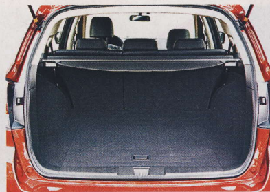
▲ Zavazadlový prostor v klasickém uspořádání 526 litrů.