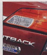
▲ Boxer diesel. Unikátní motor je dnes velmi spolehlivý. Má až nedieselový chod.