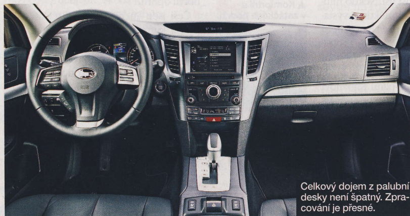
Celkový dojem z palubní desky není špatný. Zpracování je přesné.