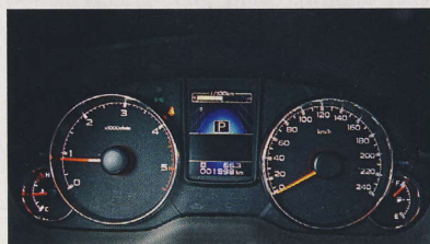
▲ Jednoduché, ale naprosto dostačující budíky. Čitelnost je výtečná.

Subaru Outback čtvrté generace je mohutným vozem. A to se nám líbí. Stejně tak chválíme světlou výšku vozu 200 mm.