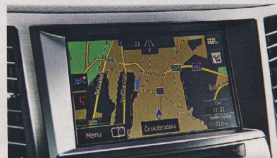
▲ Pane jo. To je grafika. Zde nás Outback nenadchl.