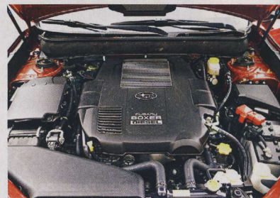
▲ Diesel se nám líbí, ve spojení s CVT by však mohl být úspornější.