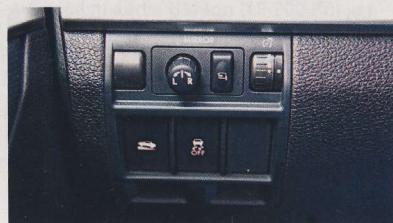
▲ Myslíme si, že auto za milion by mohlo mít hezčí a decentnější ovladače.