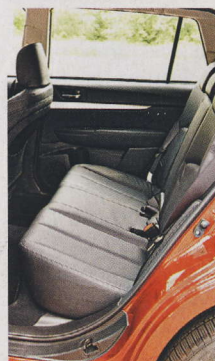
▲ Místa vzadu je opravdu hodně.