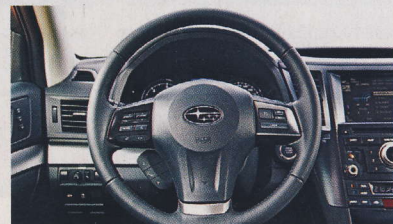
▲ Řízení je skvostné, volant se velmi dobře drží.