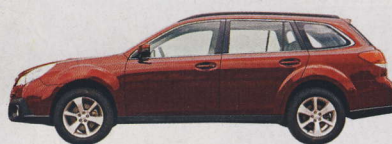
Rozvor/Délka 2745/4790 mm