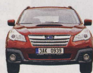
Šířka 1820 mm Rozchod 1540 mm