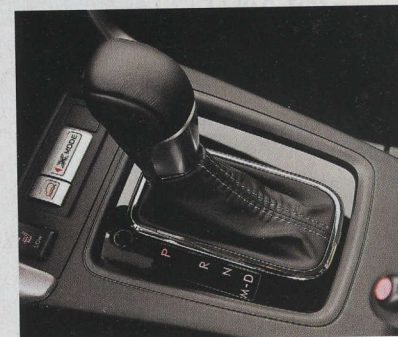
▲ K vybraným verzím je k dispozici bezstepňová převodovka Lineartronic.

▶ Navigační systém bude součástí vrcholné výbavy Executive.