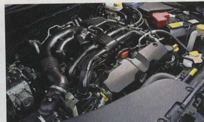
▲ Na výběr bude mezi třemi motorizacemi. Hlavní odbyt ale bude tvořit vznětový boxer o objemu 2,0 litru.