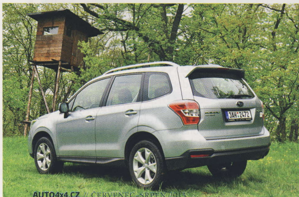
AUTO4x4.CZ // ČERVENEC - SRPEN 2013

Benzinový dvoulitrový boxer naladěný na maximální výkon 150 k není žádnou novinkou.