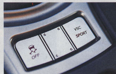
▲ Kdo umí a kdo si věří, že má auto v „ruce“, ten at' sahá po těchto tlačítkách při každém startu...

Auto má především dobře jezdit. BRZ tak dělá a navíc výtečně vypadá. Modrá barva mu hodně sluší.