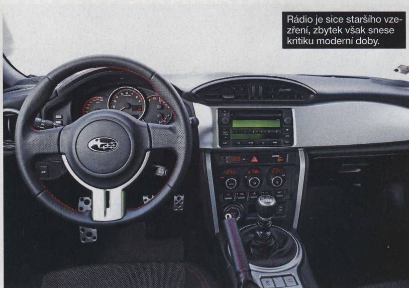
Rádio je sice staršího vze- ření, zbytek však snese kritiku moderní doby.