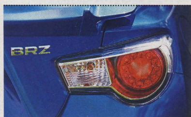
◀ Povedl se i vnější design. Nás například hodně zaujala tato koncová světla. Také se vám líbí? Zkuste nám napsat svůj dojem na naše stránky na Facebooku nebo mailem. Za reakce předem děkujeme.