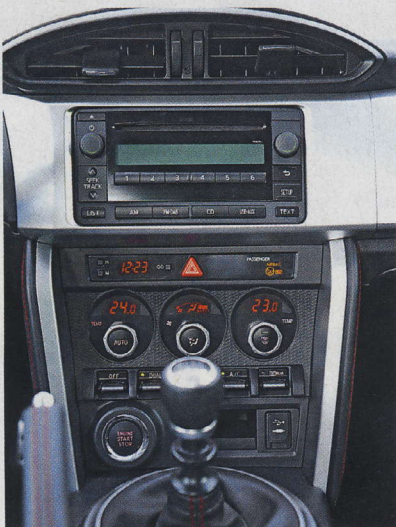
▲ BRZ nabízí startování tlačítkem i dvouzónovou klimatizaci. Ovládání je zcela jednoduché.