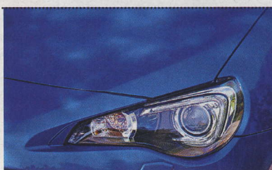
◀ Ve výbavě nemo- hou chybět ani HID xenonové světlomety a LED světla pro denní svícení. Vše najdeme již v základním provedení Active, přední mlhovky jsou ve standardu pouze pro Sport.