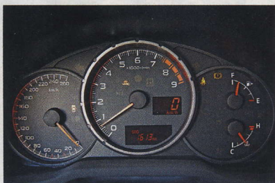
▲ Červené pole začíná až při 7500 min -1 . Pod 4500 min -1 se toho moc neděje, motor se musí točit.