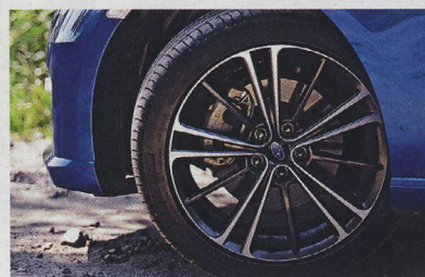
▲ Efektivní ráčky z lehké slitiny mají velikost 17 palců. Pneumatiky jsou o rozměru 215/45 R17.