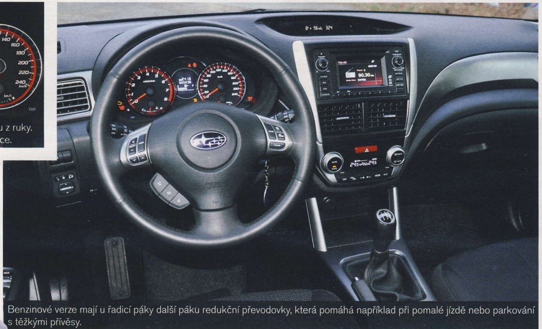
Benzinové verze mají u řadicí páky další páku redukční převodovky, která pomáhá například při pomalé jízdě nebo parkování s těžkými přívěsy.