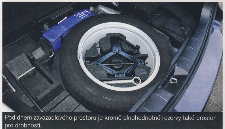
Pod dnem zavazadlového prostoru je kromě plnohodnotné rezervy také prostor pro drobnosti.

o 200 kg nižší (1485 kg). Dobrým jízdním vlastnostem sekunduje také přesné strmé řízení. Posilovač řízení přenáší zpětné vazby od kol do volantu jen průměrně. Odpružení podvozku velmi dobře filtruje všechny nerovnosti.