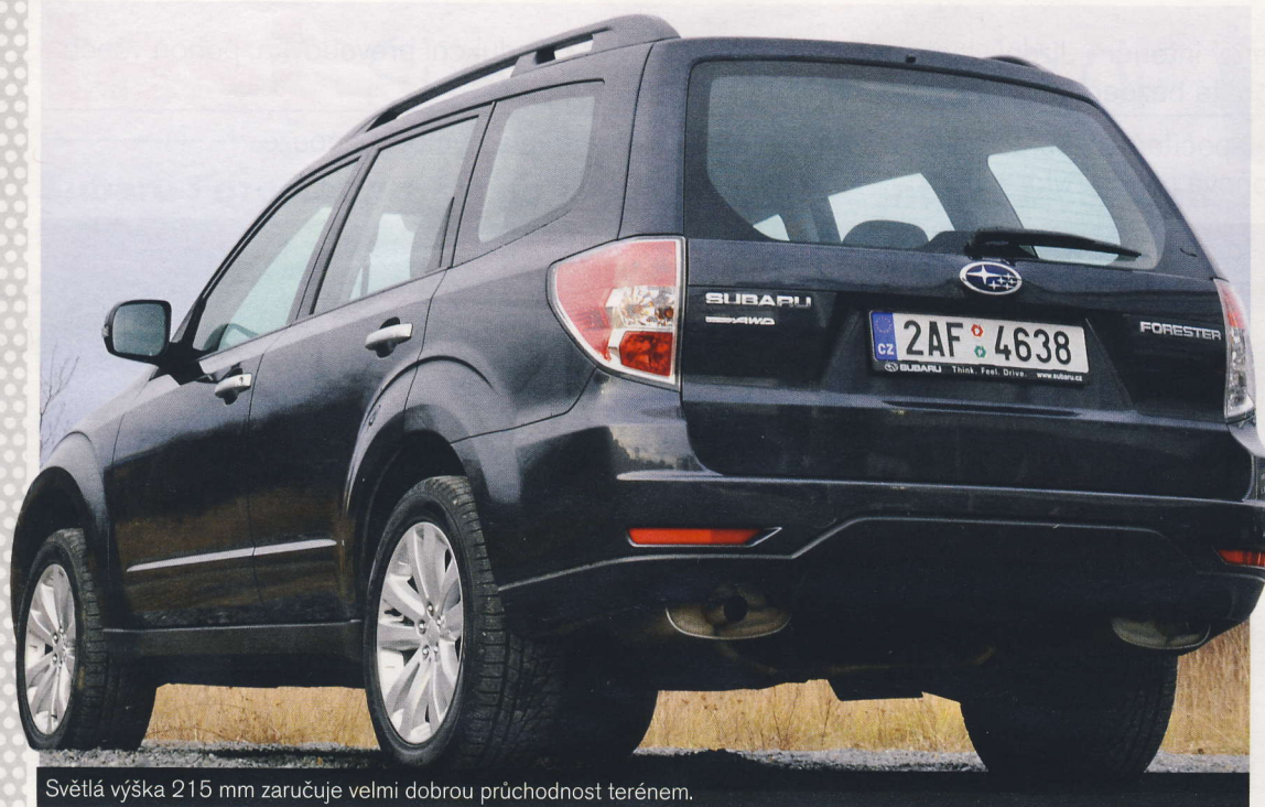
Světlá výška 215 mm zaručuje velmi dobrou průchodnost terénem.