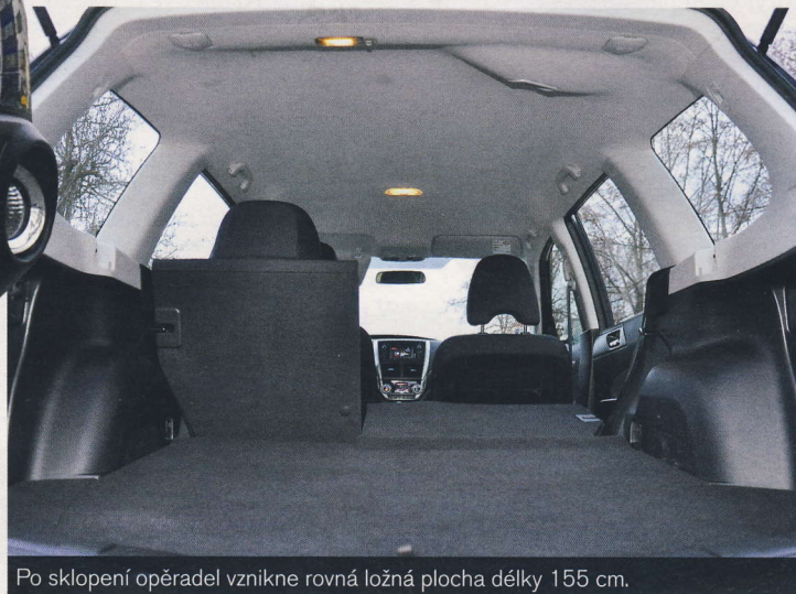
Po sklopení opěradel vznikne rovná ložná plocha délky 155 cm.