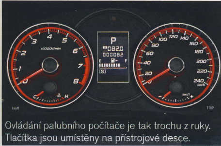
Ovládání palubního počítače je tak trochu z ruky. Tlačítka jsou umístěna na přístrojové desce.

▪ Palubní počítač nezobrazuje dojezd a dobu jízdy ▪ U zážehového motoru pouze pětistupňová převodovka