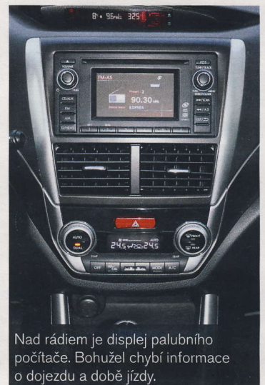
Nad rádiem je displej palubního počítače. Bohužel chybí informace o dojezdu a době jízdy.