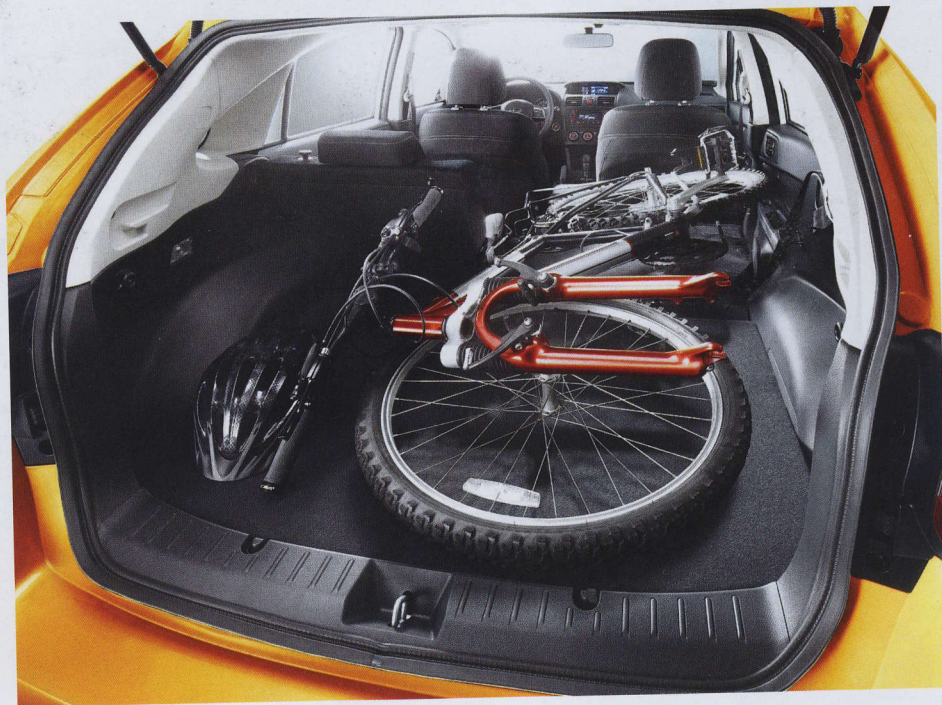
» Zlepšení prostornosti kufru o 79 litrů v praxi

Nová Impreza ve verzi XV nastoupila v únoru na náš trh ve třech motorizacích: v benzinové šestnáctistovce a dvoulitru (oba jsou to nové motory) a oblíbený boxer diesel. Motory se chlubí i s přispěním lepší aerodynamiky nižší spotřebou, té dopomáhá taky integrovaný start-stop systém u zá-