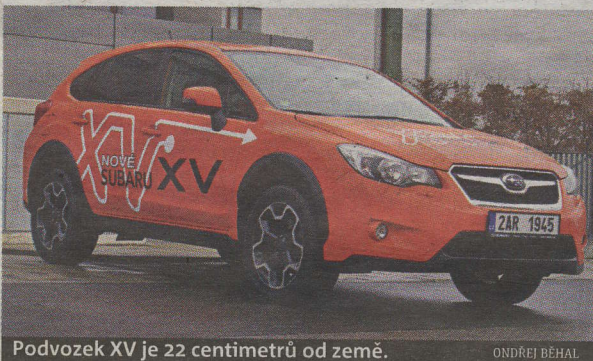
Podvozek XV je 22 centimetrů od země. ONDŘEJ BÉHAL

Motory Subaru nevynikají dynamikou, ale úsporností, což také není věc, kterou by většina lidí od značky čekala.