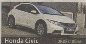
Honda Civic ONDŘEJ BÉHAL

kladní provedení s motorem 1.4 stojí od 379 900 Kč. OB