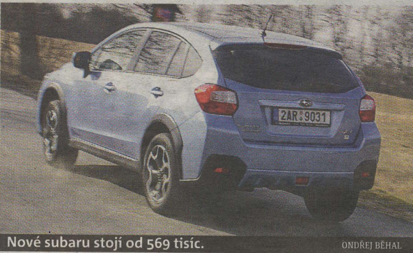
Nové subaru stojí od 569 tisíc. ONDŘEJ BÉHAL

Benzinová šestnáctistovka s automatem si podle údajů výrobce řekne o pouhých 6,3 l benzínu na 100 km, což u kompaktního SUV s pohonem všech kol nemá konkurenci.