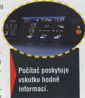
Počítač poskytuje vskutku hodně informací.