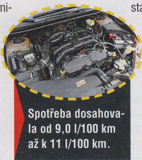
Spotřeba dosahovala od 9,0 l/100 km až k 11 l/100 km.

náprava nikam neposkakuje, přesným řízením se XV snadno vodí po silnici. Uvnitř vozu je dostatek vzdušnosti a prostoru, palubní deska je většinou pokryta kvalitními měkčenými plasty a sedadla jsou měkká a pohodlná. V zatáčkách po nich tělo zbytečně ne-