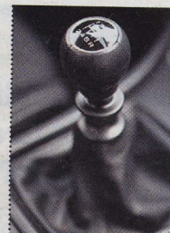
▲ Manuální převodovka má dráhy delší a nedokonalé vymezení. Místo trojky dáte občas pětku. Zda se to s dalšími kilometry zlepší, si úplně nemyslíme.