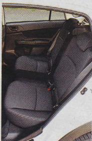
▲ Vnitřní prostor nás mile překvapil.

vými dvoubarevnými koly dokáže rozhodně zaujmout ty, kterým je slovo lifestyle blízké. Subaru vyšší zástavbou dokázalo nejen zapůsobit na emoce a dosáhnout toho, aby vůz vycíval nad ostatními na parkovišti, ale také docílit snadného nastupování do vozu. Nakládání zavazadel do kufru sice lehce komplikuje vyšší nakládací hrana (80 cm), pod víko pátých dveří si ale stoupne i přes 185 cm vysoký jedinec.