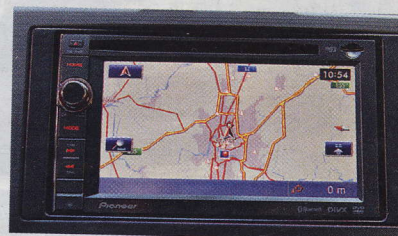
▲ Navigační a audiosystém od Pioneeru není z nejnovějších. Účel přesto plní dobře.

bohatá a sestává z těch nejdůležitějších prvků. Velmi zajímavá je bezpečnostní výbava se stabilizačním systémem a 7 airbagy včetně kolenního pro řidiče.