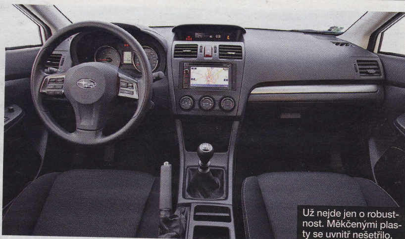
Už nejde jen o robustnost. Měkčenými plasty se uvnitř nešetřilo.