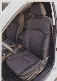
▲ Pohodlí u XV hraje prim.

Vysoká karoserie s perletovým lakem zdobená decentním oplastováním a 17palco-