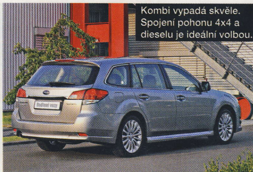
Kombi vypadá skvěle. Spojení pohonu 4x4 a dieselu je ideální volbou.