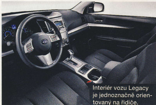
Interiér vozu Legacy je jednoznačně orientovaný na řidiče.

Na našem trhu se prodávají tři varianty modelu Legacy – sedan, kombi a zvýšený crossover Outback. České zastoupení dokonce pro milovníky zážehových motorů nabízí variantu LPG, kdy spotřeba už není největší problém. Teď by to chtělo ještě něco s cenou. ■