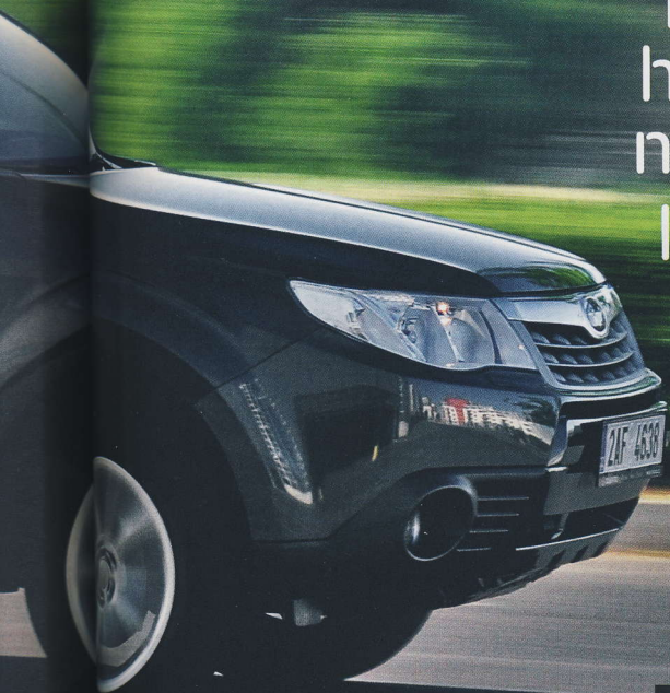
Pod přední kapotou došlo ke generační výměně

Nové je na foresteru hlavně to, co není na první pohled vidět