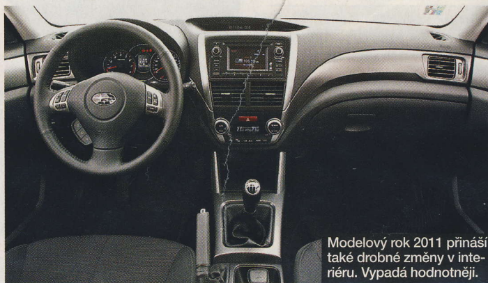
Modelový rok 2011 přináší také drobné změny v interiéru. Vypadá hodnotněji.

Forester 2011 lehce prokoukl a nadále nabízí alternativu těm, kteří takový vůz skutečně potřebují. ■