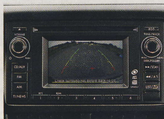
▲ Audio s 4,3palcovým displejem s couvací kamerou je u XS standardem.