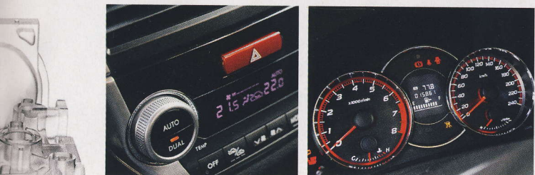
Vroubkování po obvodu usnadňuje manipulaci s kolečkem. Optitronové přístroje se dobře čtou i za slunce.