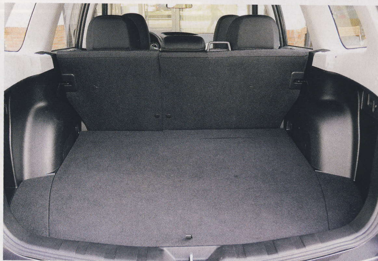
Zadní opěradla se sklápějí skoro do roviny. Zavazadelník pojme v základu 0,450 m 3 .