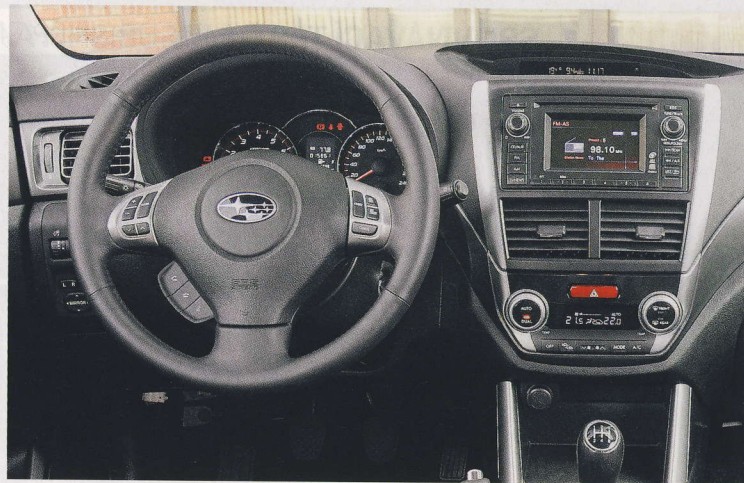
Stříbřité lišty rozrážejí masu černého plastu. Potěší správné dílenské zpracování.