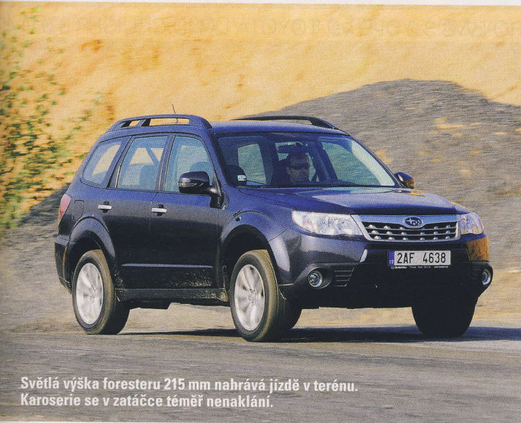
Světlá výška foresteru 215 mm nahrává jízdě v terénu. Karoserie se v zatáčke téměř nenaklání.