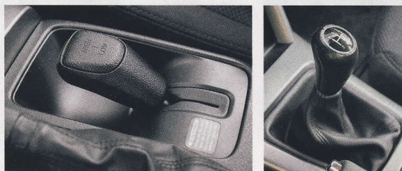
Redukci Dual range dostanete výhradně s pětistupňovým manuálem. Kulisa řazení potřebuje zkrátit a zpřesnit.