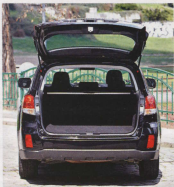
▲ Zavazadelník je praktický. V základu pojme dokonce 526 litrů batožiny.