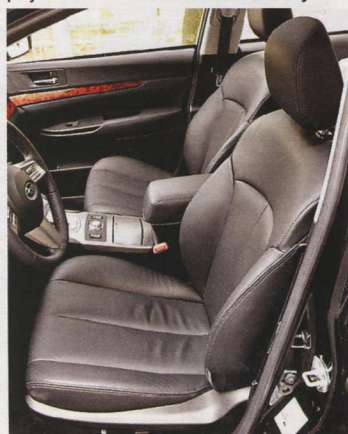
▲ Poskytují až nečekaně velkorysé posezení. Chybí jim ale boční vedení.