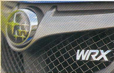
Maska chladiče s upravenou mřížkou se tvarem přibližuje k špičkovému STI