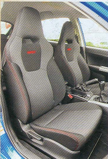
Anatomická sedadla s integrovanými opěrkami hlav schopně kombinují oporu s pohodlím

novému tlumicímu ventilu tolik nepřenáší rázy a silentbloky z STI zlepšují stabilitu. Po jejím vypnutí vykouzlí vůz pěkný smyk, pro větší efekt poslouží krátké trnutí ruční brzdou. Čím tvrději jdete na věc, tím větší máte požitky z jízdy.