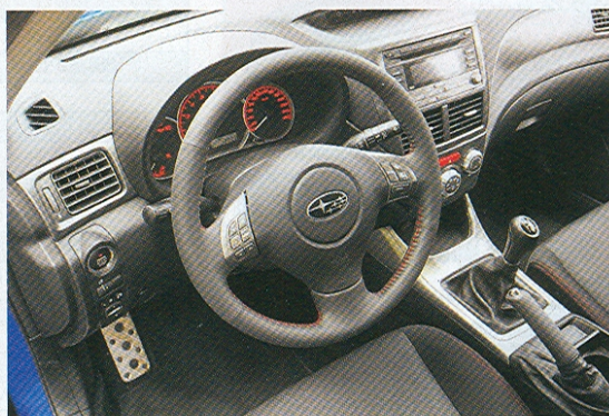
Startovací tlačítko patří spolu s bezklíčovým přístupem k sériové výbavě. Ostřejší verzi v kokpitu prozradí hliníkové pedály a mohutnější volant, posaz za ním chválíme.