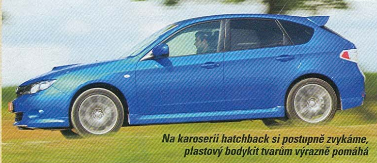
Na karoserii hatchback si postupně zvykáme, plastový bodykit tvarům výrazně pomáhá