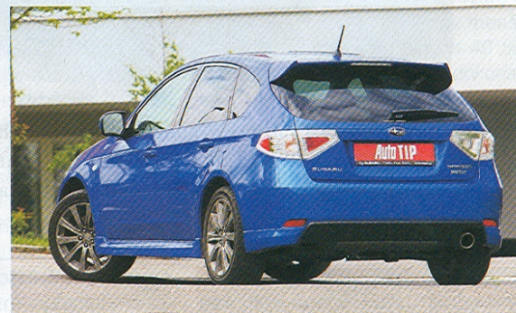
Tmavá kola patří mezi výsady nové verze 265 stejně jako zvětšený zadní spoiler