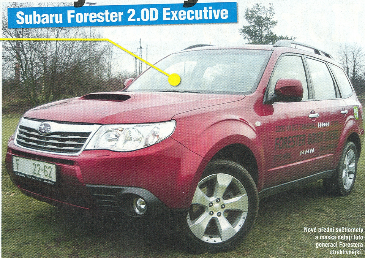
Nové přední světlomety a maska dělají tuto generaci Forestera atraktivnější.

Pro roztažení rolety interiér krásně prosvětlí, jakmile se ale začne dávat plyn, cestujícím na zadních sedadlech pořádně vlají vlasy. Únik světla se dovnitř dostává až moc! Je to však jediná vada na jinak velmi pohodlném foresteru.